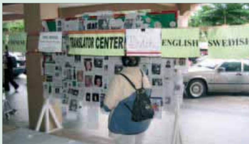
Listor och annonser med saknade. Tolkhjälp erbjuds.

Han beräknar att det kommer ta lång tid innan alla omkomna svenskar har lämnat Thailand. – Den svåraste delen kommer att återstå för alla dem vars anhörig inte kommer att återfinnas.