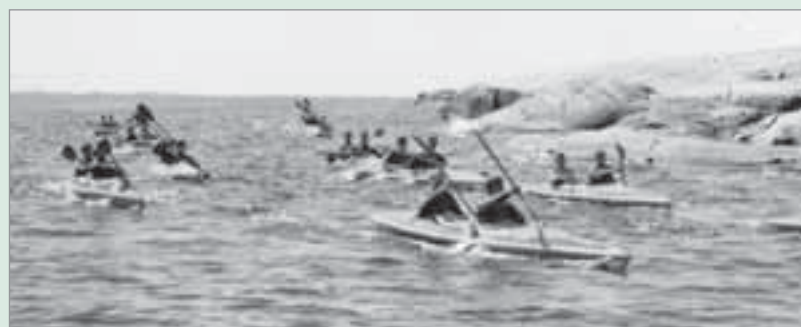
Kanoten är det fortskaffningsmedel på vatten som alla kustjägare kommit i kontakt med.

och vissa båtar fick minräls, andra utrustades som målbogserare. Ett par blev till och med ledningsbåtar i de nya amfibiebataljonerna och utrustades med gigantiska stagade högmast. Vid en plötslig kraftig sjöhävning då två sådana ledningsbåtar låg förtöjda vid Yttre Hamnskärs brygga hakade masterna i varandra och hela arrangemanget brakade mer eller mindre i däck, som tur var utan att någon personskada uppstod.