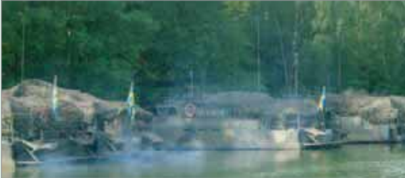
Alla bilderna visar på kända situationer för kustjägare.

Vi har klivit in i år 2005 och tidpunkten för vårt 50-års jubileum närmar sig med stormsteg. Det är ungefär 20 månader kvar till den 15 september 2006 och det firande som ska omfatta tre dagar, fredag till söndag, på lämplig kustjägerplats.