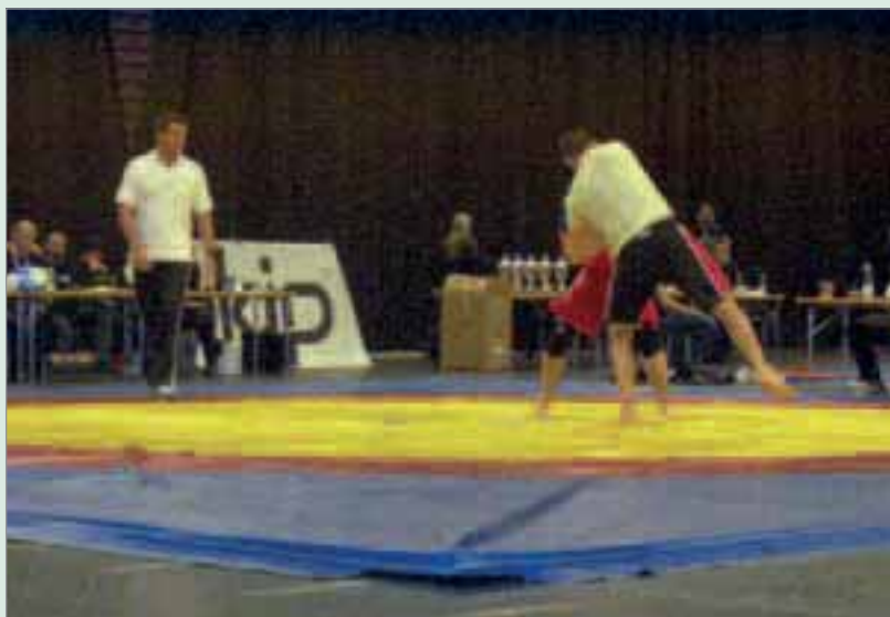
Spets på mattan mot världseliten