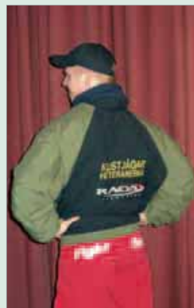
En sponsrad Spets.

– Ska man vara realistisk så kommer jag nog inte att kunna gå så långt. Visst har jag tränat mycket, både i Tyskland och i Brasilien, men hälften av dom som ställer upp i den här tävlingen är proffs och sysslar med SW på heltid. I Brasilien vann jag mot en rätt känd kille vilket är anledningen till att jag får vara med. Det är ju trots allt VM-kval så det vore väl märkligt om motståndet inte skulle vara hårt.