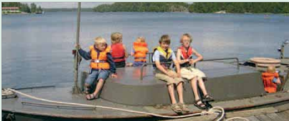
Vitsgarn - barnens paradīs.

Styrelsen föreslår att årets resultat balanseras i ny räkning.