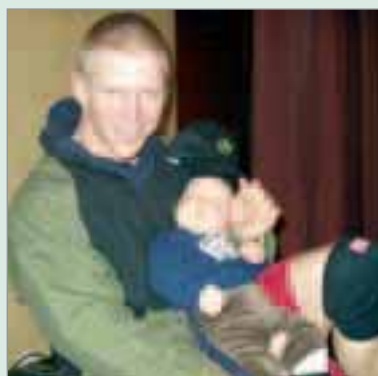
En framtida wrestler?

– Som jag sa så började jag söka andra jobb. Av en tillfällighet kom jag in på en välrenommerad flygledarutbildning i Luxemburg och tog chansen. Jag lyckades samtidigt lura med mig min nuvarande fru som då jobbade som officer i flottan. Idag bor vi i Tyskland. Jag jobbar som flygledarinstruktör i Maastricht, min fru har skolat om sig till läkare och vi har en son på 3 månader. Vi trivs jättebra.