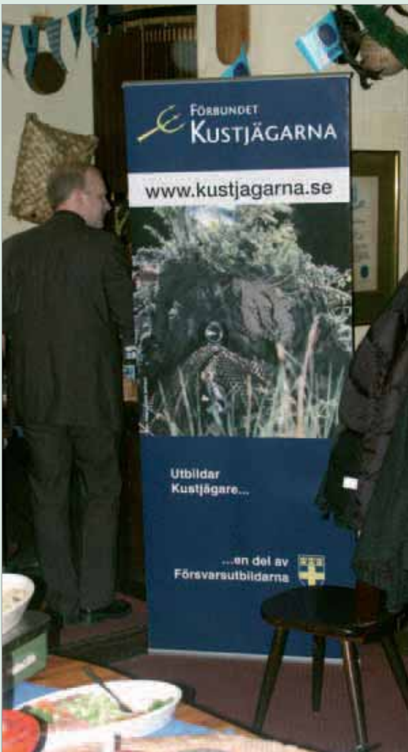
KJVs och FKJs nya informationsskärmar var på plats.