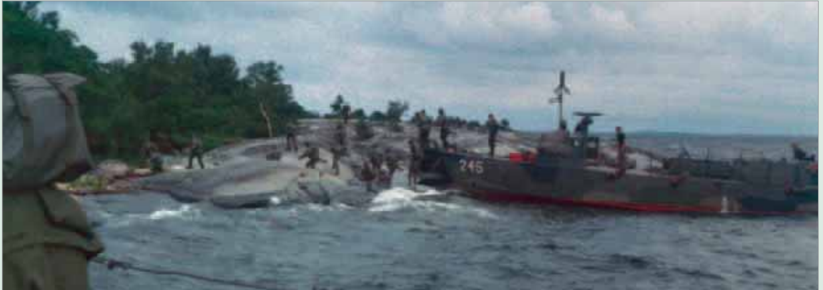
200-båtarna tålde hårda tag mot klipporna.