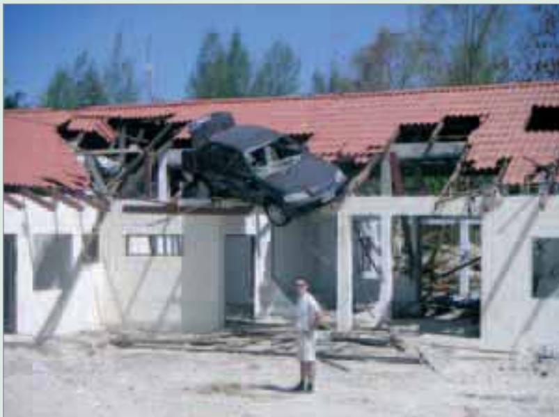
Oerhörda krafter var i spel. Här i Blue Village.

Svenska kyrkan, Rädda barnen, Svenska lottakåren, Svenska begravningsbyråers förbund och Kärnkraftsinspektionen på plats. Alla är organiserade i en stab som leds av UD och Räddningsverket.