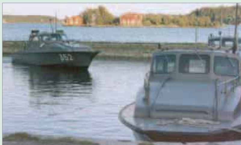
330-båtarna var gruppåtar under lång tid.

Vid ankörning gällde det för båtchefen att sköta spakarna rätt och se till att backslaget tog innan back lades i. Vid fler än ett tillfälle blev inte fartminskningen den önskade och plutonen lastade ur längre upp på land än vad som var tänkt. Oftast var det bara att bogsera ner båten från klipporna och fortsätta att köra, 200-båtarna var otroligt robusta och hållbara.