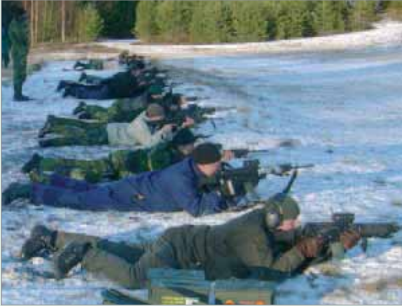
Inskjutning från 30 m för att kolla att sikten är rätt inställt.