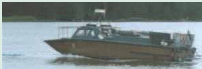
51:an köptes speciellt som ledningsplattform för kustjägerledningsgrupp. Båten var också speciell på så sätt att den mest låg på varv.

200-båtarna var som sagt gjorda för landstigning och åtskilliga plutoner har rusat ur de två stävportarna vid så kallade våldsamma landstigningar, ofta vid förevisningar av olika slag och synen av en båt som nästan bokstavligt kör rakt upp på klipporna och spydde ut skjutande kustjägare var en spektakulär syn och upplevelse.