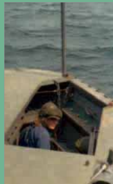
Färdiga för landstigning i utgångsläge för anfall, UFA.