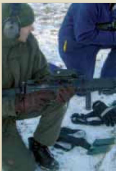
Ak 5CF med rödpunktssikte.

9/2, 23/2, 9/3, 23/3, 6/4, 20/4, 4/5, 18/5, 1/6, 15/6 och 29/6 – tiderna och kurskoderna återfinns också i Kurskatalogen.