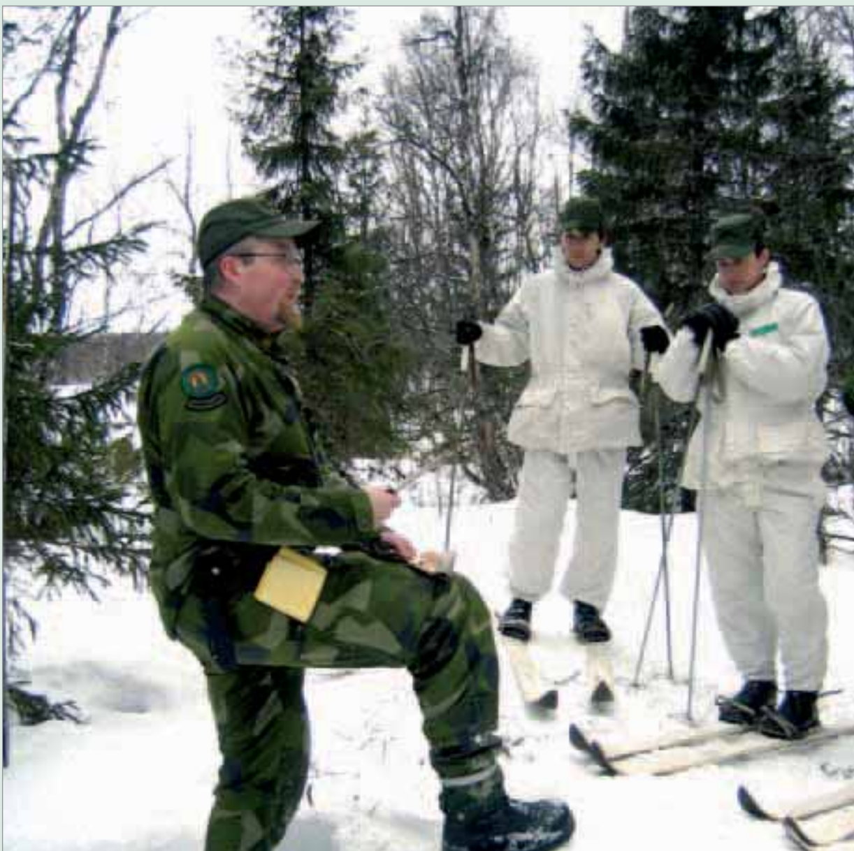
CFB har många ungdomskurser på programmet.