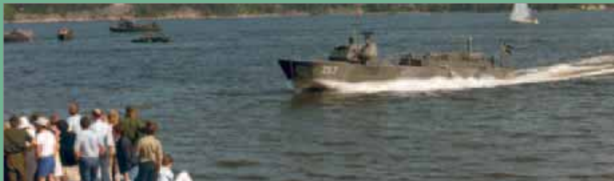
200-båt under inkörning för "våldsam landstigning".