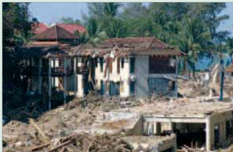
Förstörelsen efter flodvågen genom Khao Lak var oerhörd.