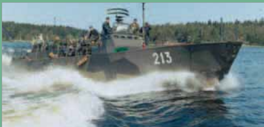
20 knop fullfart framåt...

Det var en snabb resa inom det vad som kan benämnas