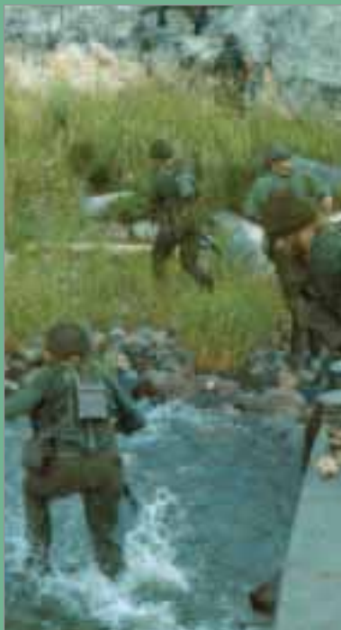
Ibland kom inte båten ända fram till strandkanten.

Bevakningsbåt 66 stävade under många år omkring som