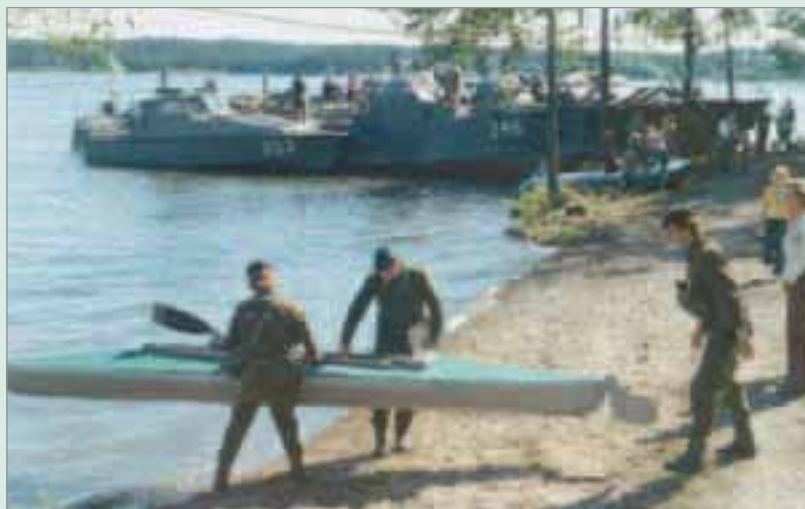
330-båt, 200-båtar och Klepperkanot – kustjägarnas transportmedel under många år.

200-båten blev en allmän arbetshäst inom kustartilleriet